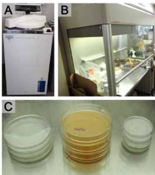
図2：純粋培養に必要なもの A：オートクレーブ。高温・高圧にして器具等を煮る電気圧力釜。B：クリーンベンチ。ガラス張りの中で微生物を捕捉するフィルターを通して風を起こし、浮遊する微生物を除去してほぼ無菌とする。C：寒天培地。ガンマ線滅菌された容器内に栄養分を含む寒天を注ぎ固める。ここに微生物の一部を載せるなどで培養できる