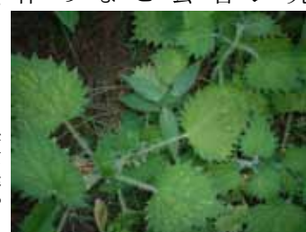
トゲあり植物(イラクサ)の中で、生きながらえるイヌタデ(奈良公園内)。イラクサがないといずれシカに食べられてしまう。

になるという例でした。もっと直接的に植物が別の植物を助けるという例があります。それが、草食動物から守るという作用です。シカなどの草食動物の多い地域では、自分の身を守るためのトゲや毒を備えた植物が生育していることがありますが、このような防御植物は、他の植物をも草食動物から守ってしまふことがあるのです。つまり、トゲを持たない植物がトゲを持つ植物の草陰に生えていければ、動物に見つからず食べられずに生きながらえることができます。植物が別の植物に助けられるというプラス作用は、世界的に植物の研究者の間で注目されています。研究者の中には、放牧地など草食動物の多い地域では、植物間のプラス作用が植物の多様性維持にとっても重要なたと考える人もいます。実際私の研究でも、シカで有名な奈良公園で、このような植物間のプラス作用が観察できました(写真)。