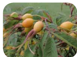
カラフトイバラ 実が沢山ついています。