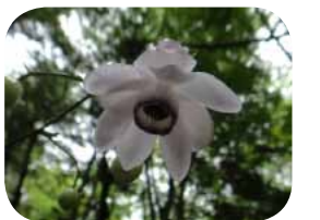
レンゲショウマ 樹木園で、ひっそりと咲いていました。