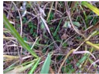
ススキの株の中心部で、小さな植物が定着している様子。

そんな無情な競争社会の中でも、まれに植物が他の植物を助けるケースがいくつか知られています。たとえば、極度の乾燥地帯では、先駆的に定着する低木種が日陰をつくり、その下では土壌の水分が保たれます。その結果、低木の下はやや湿った環境に他の植物が定着できるようになりやすくなります。いわば、低木が他種の定着を助けていると見ることができそうです。火山噴火後の不毛地帯でも同様に、先駆的に定着する植物によって、土壌の水分や養分、あるいは土壌そのものが蓄積し、他の植物の定着が可能になる現象が報告されています。富士山の噴火跡地で、イタドリが定着がその後のイネ科やキク科植物の定着を容易にさせることはよく知られています。他にも、菌根菌と共生するマメ科植物は、窒素固定によって土壌の窒素養分を高める結果、その近くに他の植物の成長を促進させる現象もあります。また、菅平でも普通に見られるススキは何十年もかけて大きな株に育つのですが、株は中心部が枯れて毎年ドーナツ状に茎を出し、年々そのドーナツの輪が大きくなって成長していきます。この時、中心部の茎のない場所は空き空間となるため、もしかすると他の植物の定着により場所になつていくかもしれません。このススキの作用はまだ誰も検証していないので、いつか研究してみたいと私は思っています。