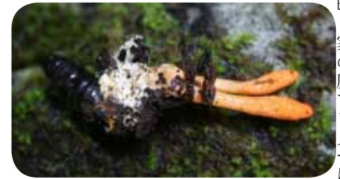
サナギタケ(鱗翅類の蛹から発生)

そんな「冬虫夏草」、とても珍しいものと思われがちですが、意外と身近に存在しています。菅平高原実験センターの森の中でも、ハチタケ・サナギタケ・アワフキムシタケといった「冬虫夏草」が見られます。森の中だけではなく、神社の境内や公園など私たちのすぐ近くでこういった菌類は生活しています(私は幼い頃、家の庭でも見つけています!)。「冬虫夏草」が特によく見つかるのは、いつもじめじめ湿っている場所です。沢沿いに生えているコケの間や落ち葉の間、葉っぱの裏などを丁寧に探していくと「冬虫夏草」が見つかります。目立つ色をして大きいものから、地味で1cmに満たないものまで様々で、小さく見つけにくいものほど、見つけた時の喜びはひとしおです。皆さんもそんな小さな喜びを探しに、森へ出かけてみてはいかがでしょう? (山田宗樹)