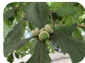
ミズナラ 少しずつ、ドングリがふくらんできています。