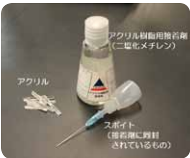
写真1 使用したアクリル樹脂用接着剤とアクリル。ホームセンターで購入できます。 注意：二塩化メチレンは揮発性が高く、毒性があります。取り扱いには十分注意しましょう。

準備するものは、アクリル樹脂用接着剤（二塩化メチレン）、透明アクリル、スポイト、ガラス板（今回はポリエステルシートで代用）、黒い布や紙、