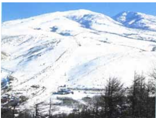
1970年頃の撮影と推測される根子岳

左の写真は、リフトの状況から1970年頃と推測される根子岳の様子です。下の写真は、同じ構図になる場所を探し回って菅平の太郎山から2015