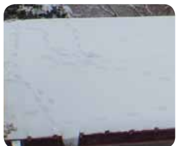
大明神寮の屋根についていたテンの足跡。ずいぶんかけ回っていたようです。

今年の冬は、なかなか冷え込まず、菅平高原実験センターでも大明神の滝が凍りつくのが遅れていました。もう少し冷えて欲しいなあ…なんて思っていたら雪が降り、あつという間に冬らしい景色になりました。雪が積もると、あちらこちらに動物の足跡が見られるようになります。よく見られるのはニホンリスやキツネ、テン、ノウサギです。特に、テンの足跡は昨年に比べて多いように感じています。どこかに美味しいものがあるのかな？