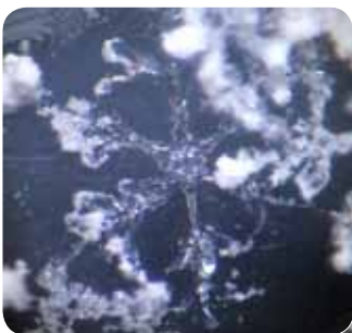
写真3 実体顕微鏡で見た、雪の結晶のレプリカ。