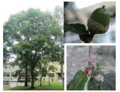
ブナ科コナラ属ミズナラ Quercus crispula Blume