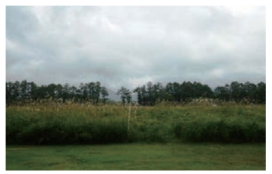
センター内スキ草原