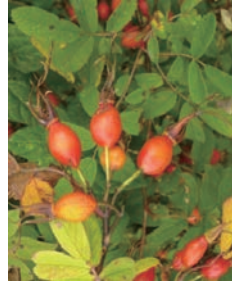
バラ科バラ属カラフトイバラ Rosa amblyotis C.A.Mey.