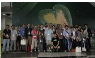
IKITEプロジェクトメンバーの集合写真